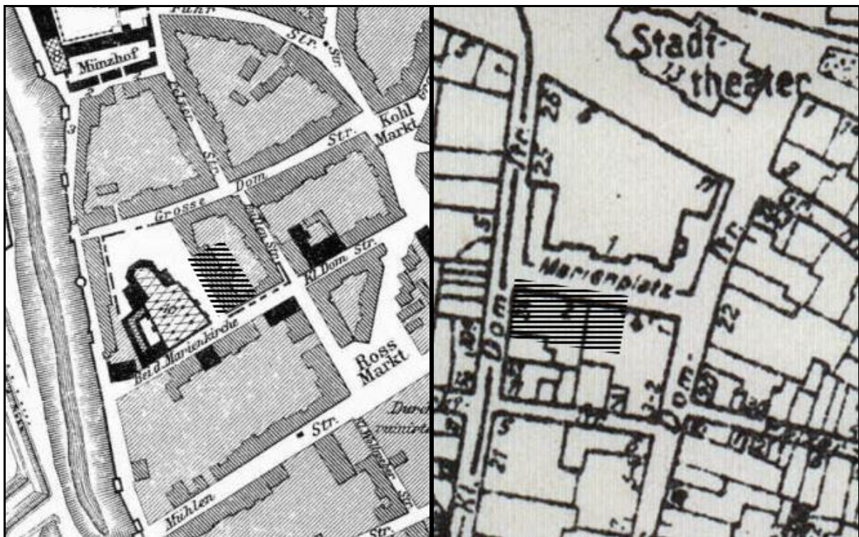
Ilustracja 2. Fragmenty planów Szczecina z 1721 1 r. oraz 1937 2 r. z zaznaczonym orientacyjnym położeniem planowanej inwestycji (zakreskowane obszary).